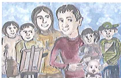
Gmina Kłobuck dla rodziny - Karta Dużej Rodziny