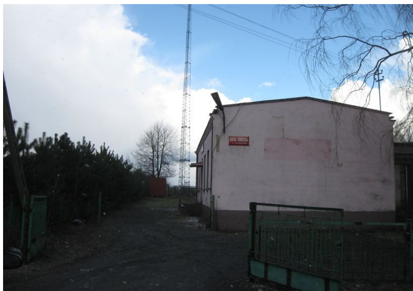
Fot. 3. Budynek Klubu Rolnika

Dzieci i młodzież z Gruszewni terytorialnie podlega pod Zespół Szkół w Libidzy, w którego skład wchodzi: Szkoła Podstawowa im. H. Sienkiewicza z Oddziałem Przedszkolnym oraz Gimnazjum.