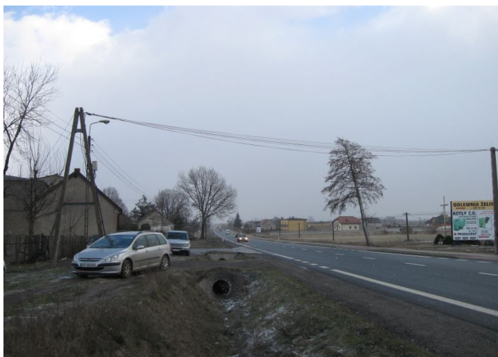
Fot. 4. Gruszewnia – brak chodnika

Jednak mieszkańcy Gruszewni nie tego spodziewali się po dawno wyczekiwany remoncie DK 43. Powstał chodnik, ale po stronie gdzie mieszka zaledwie jedna czwarta mieszkańców wsi. Reszta ma znacznie gorsze dojeżdżenie do domów czy na przystanek autobusowy, ze względu na zwężenie pobocza.