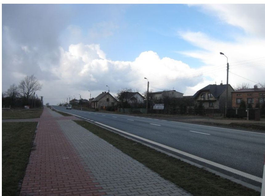
Fot.2. Ścieżka rowerowa

W Gruszewni ze względu na układ przestrzenny - nie ma rynku, parku i skwerów. Od 2008 roku istnieje ścieżka rowerowa biegnąca wzdłuż chodnika przez całą miejscowość aż do Libidzy (do szkoły). Na terenie wsi jest to wydzielona część chodnika – ciemniejsza kostka, na odcinku od Gruszewni do Libidzy tylko utwardzona tłuczniem.