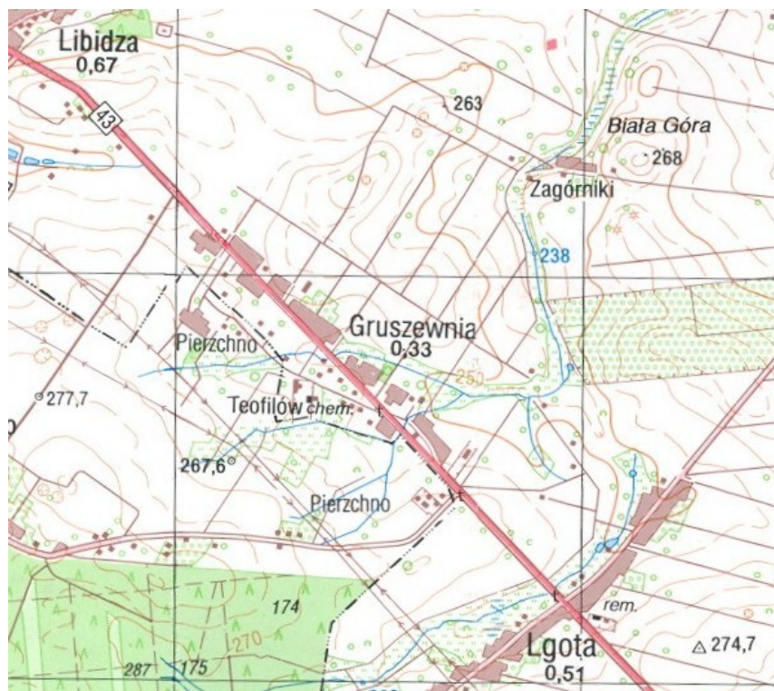
Rysunek 3. Lokalizacja miejscowości Gruszewnia