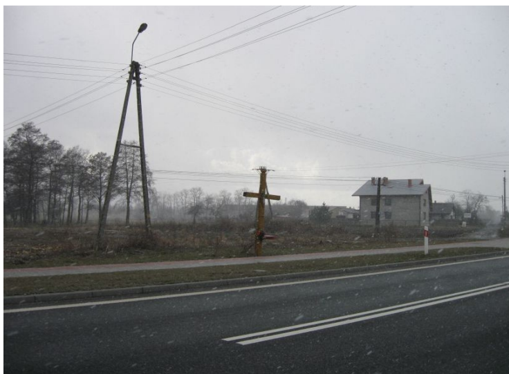
Fot. 1. Krzyż przydrożny

Wyżej wymieniony krzyż przydrożny został odnowiony w 1961 roku. Zasluguje on na uwagę ze względu na piękne ludowe dekoracje płaskorzeźbionymi emblematami Męki Pańskiej.