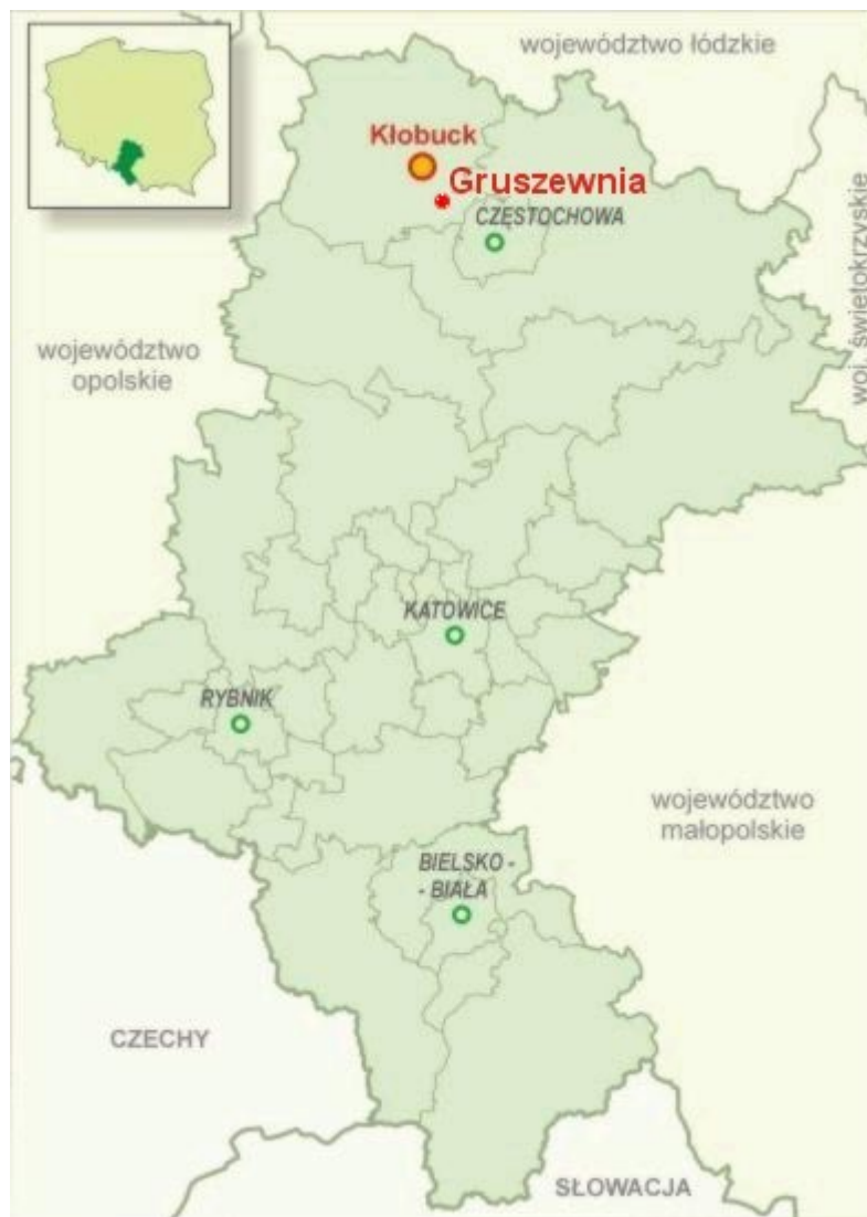
Rysunek 1. Lokalizacja miejscowości Gruszewnia w województwie śląskim i powiecie kłobuckim.

Miejscowość Gruszewnia położona jest w południowo-wschodniej części gminy Kłobuck, w powiecie kłobuckim województwa śląskiego.