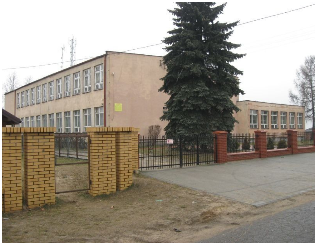
Fot. 5. Zespół Szkół w Lgocie

Historia szkoły w Lgocie sięga czasów cara Aleksandra III. Pierwotny budynek szkoły wybudowano przy drodze z Kłobucka do Częstochowy. Po drugiej wojnie światowej również w domach prywatnych z uwagi na zbyt małą bazę lokalową szkoły. Pod koniec lat sześćdziesiątych XX wieku podjęto budowę nowej szkoły, którą ukończono w roku 1970. Nowa lokalizacja placówki, jak się szybko okazało niekorzystna, spowodowała drastyczny spadek uczniów. Uczniowie zamieszkujący w sąsiedniej Gruszewni przenieśli się do szkoły w Libidzy. Od tej chwili nastąpił powolny upadek szkoły. Cztery lata temu Władze Gminy przekazały prowadzenie szkoły Stowarzyszeniu.