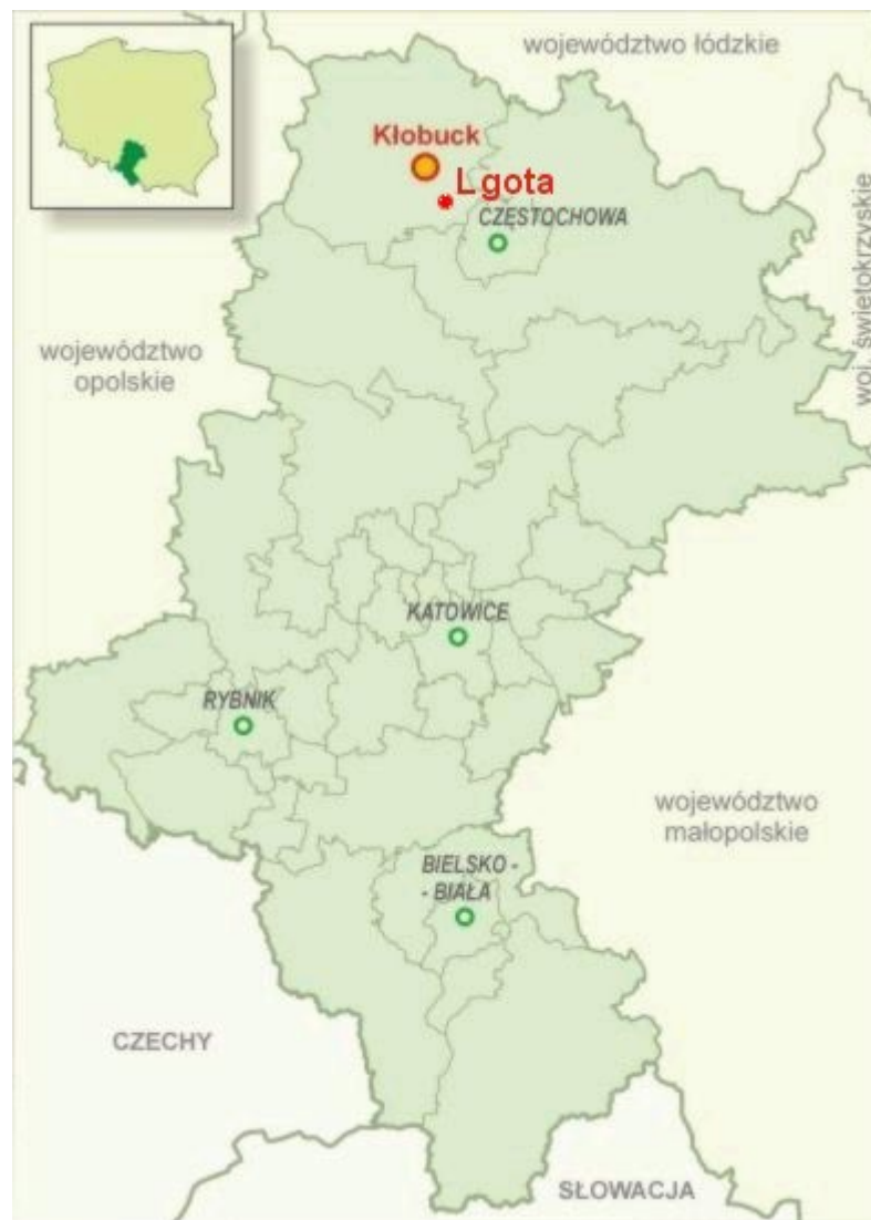
Rysunek 1. Lokalizacja miejscowości Lgota w województwie śląskim i powiecie kłobuckim.

Miejscowość Lgota jest położona w południowo-wschodniej części gminy Kłobuck, w powiecie kłobuckim województwa śląskiego.