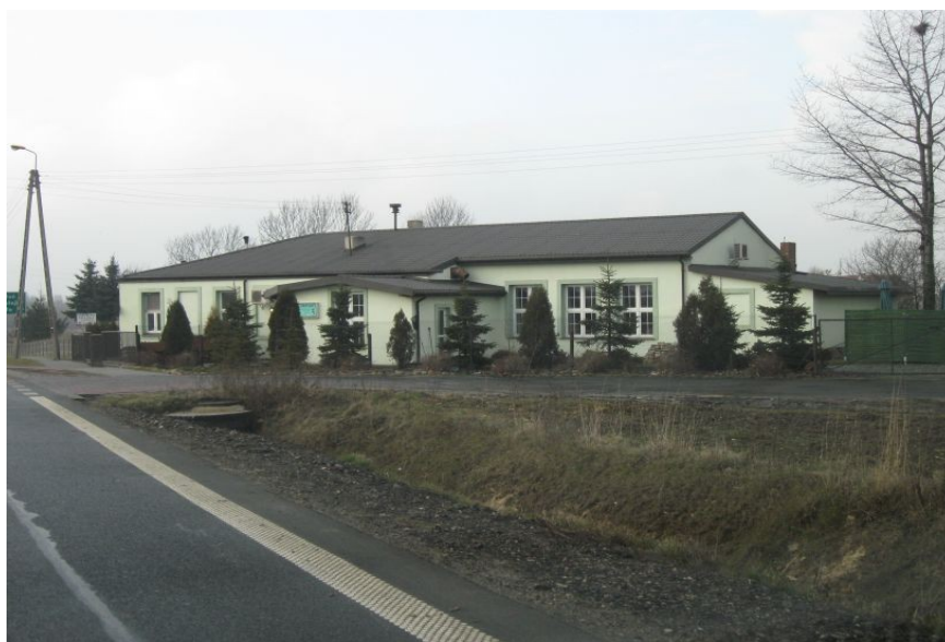
Fot.8. Budynek remizy