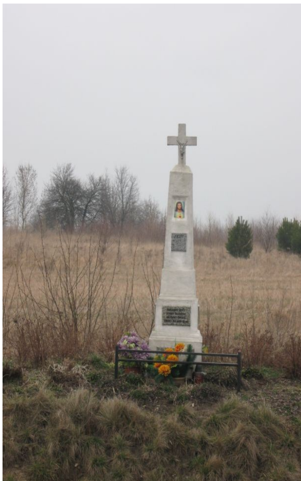
Fot. 4. Kapliczka pod Lgotą (biały krzyż)

Na uwagę zasługuje też urokliwa kapliczka (biały krzyż) znajdująca się przy samej drodze krajowej nr 43, na krótkim odcinku od granicy Częstochowy z Lgotą. Kiedyś wyróżniała ją widowskie położenie, wewnątrz koła kilku drzew, prawdopodobnie zasadzonych w tym samym czasie, kiedy budowano kapliczkę. Obecnie drzewa są usunięte. Wyraźnie zachowany napis głosi, że fundatorami byli Franciszek i Ewa Grabarowie w roku 1932. Prócz tego wyryto na niej kilka liturgicznych sentencji. To miejsce otoczone jest stałą opieką przez mieszkańców.