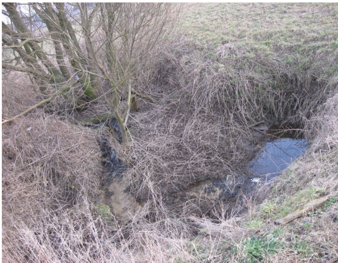
Fot. 1. Ciek wodny w Lgocie

Na terenie wsi znajdują się złoża „Lgota” posiadające zasoby zarejestrowane (Stolarski 1981). W złożu tym występują głównie piaski z domieszką żwirów przydatne dla celów budowlanych. Zostało ono zakwalifikowane ze względu na powszechność występującej w niej kopaliny i ochronę środowiska do klas 4 i A. Złoże to posiada 1 ha powierzchni. Przy średniej grubości nakładu 0,2 m i miąższości złoża wynoszącej 6,18 m stosunek N/Z wynosi 0,039. Złoże jest suche, a parametry jakości określają: punkt piaskowy – 91 %, średnia zawartości pyłów mineralnych wynosi 6 %.