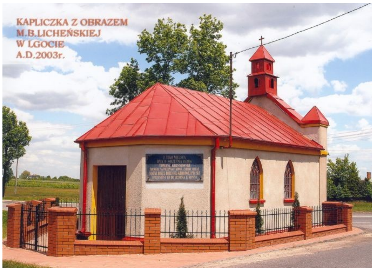
Fot. 2. Kapliczka w Lgocie