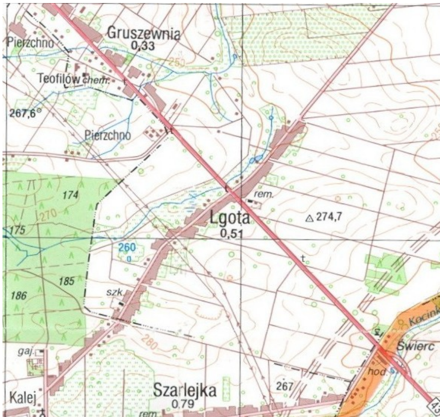
Rysunek 3. Lokalizacja miejscowości Lgota