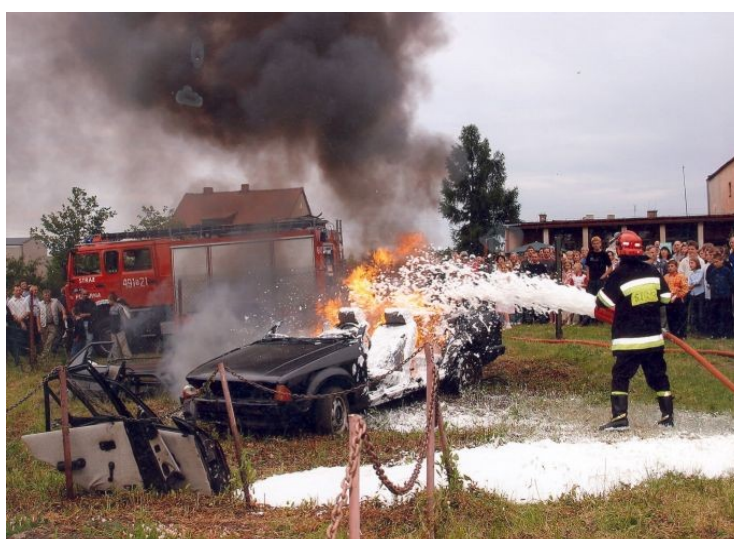
Fot.6. Pokazy strażackie na festynie

Szkoła obecnie jest nie tylko miejscem nauki, ale także gromadzi się w niej cała społeczność wiejska z okazji różnych imprez i uroczystości typu festyny, biesiady, zebrania wiejskie, pikniki, zabawy okolicznościowe. W budynku szkoły mieści się siedziba Rady Sołectkiej.