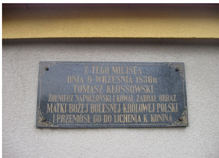
Fot. 3. Tablica pamiątkowa umieszczona na kapliczce w Lgocie