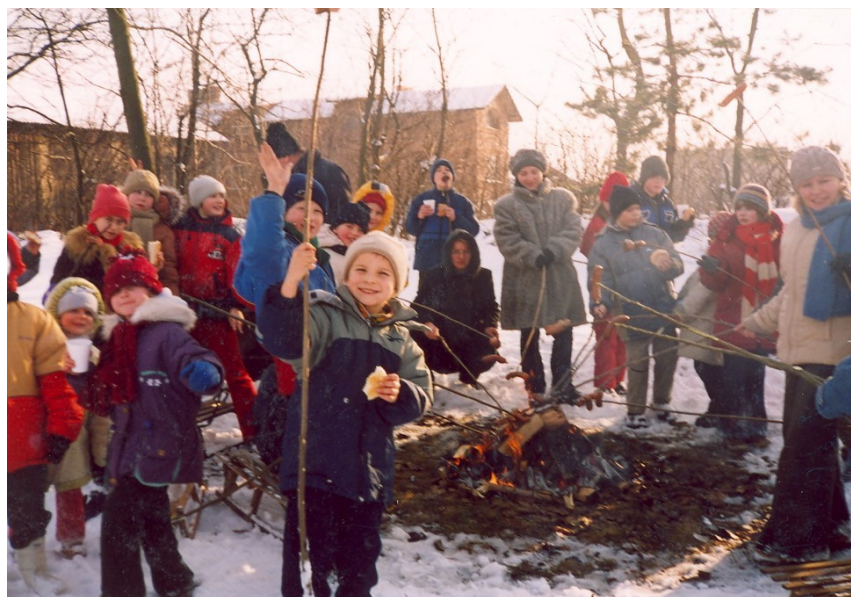
Fot.7. Piknik zimą