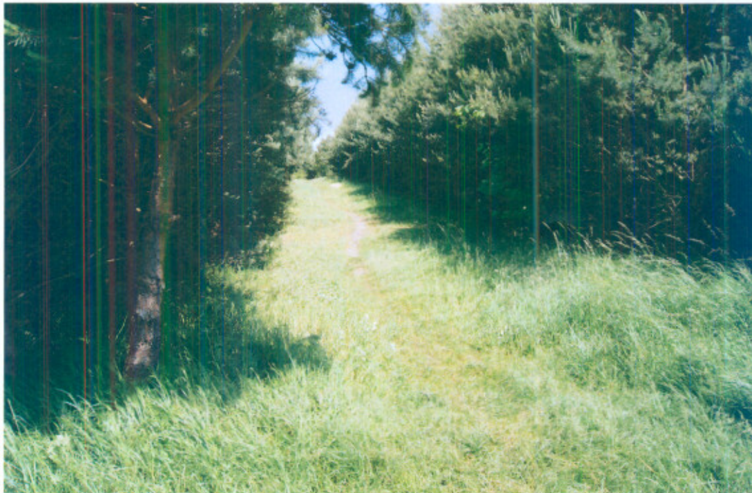
Fot.1. Roślinność w Libidzy

Libidza położona jest w strefie umiarkowanego klimatu środkowo-europejskiego powodującego słoneczną pogodę latem i jesienią oraz zachmurzenie, deszcze, odwilże i mgły w okresie zimowym.