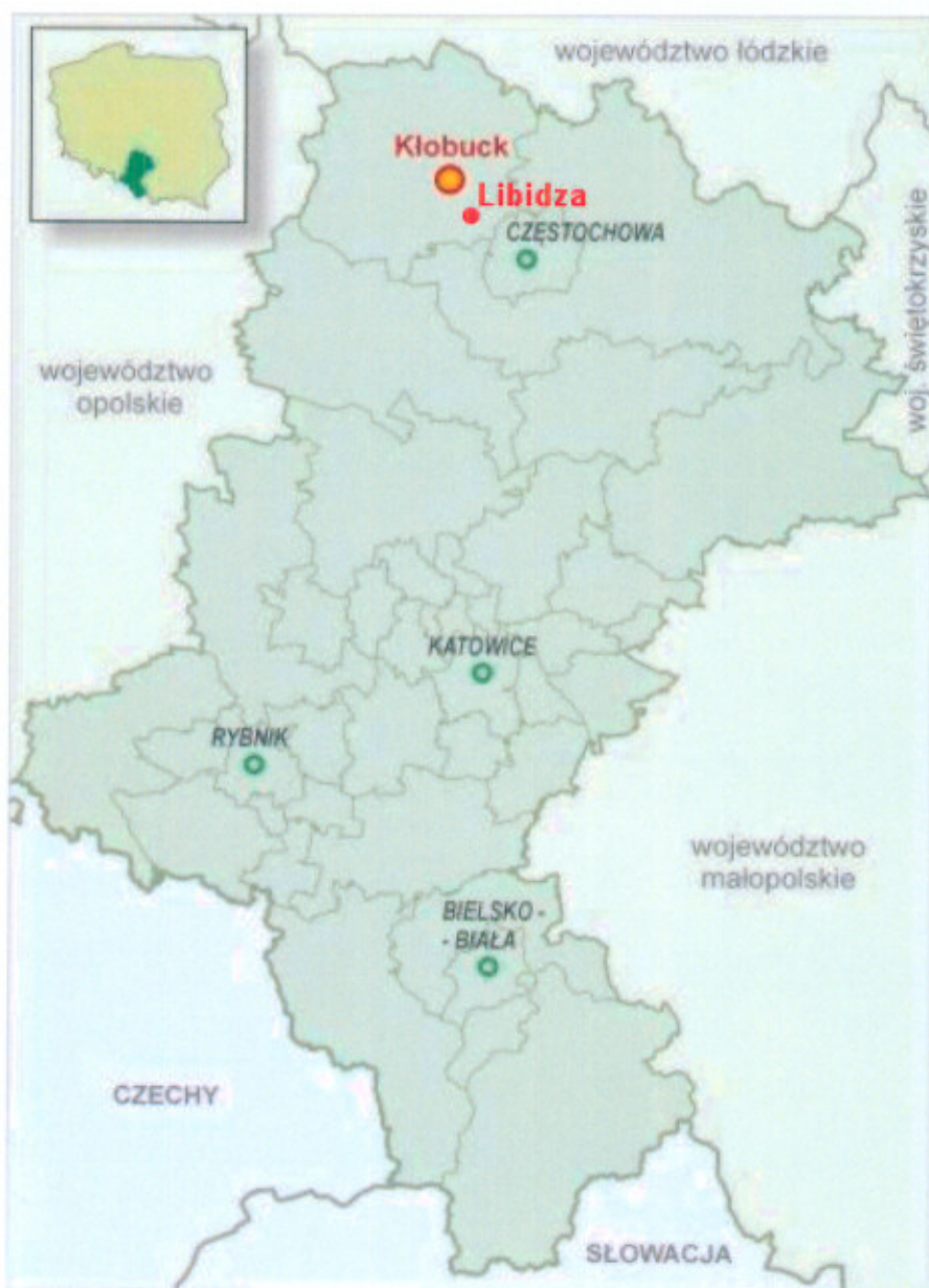
Rysunek 1. Lokalizacja miejscowości Libidza w województwie śląskim i powiecie kłobuckim

Miejscowość Libidza położona jest w północno-wschodniej części gminy Kłobuck, w powiecie kłobuckim województwa śląskiego.