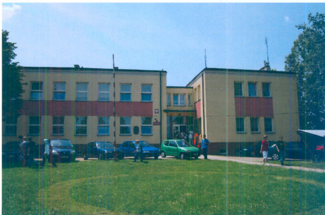
Fot. 7. Zespół Szkół w Libidzy

Przy Zespole Szkół znajduje się biblioteka szkolna, która w swoich zbiorach posiada 8000 woluminów.