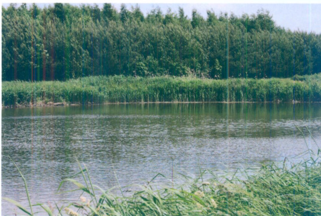
Fot. 2. Stawy rybne w Libidzy

Pomiędzy Libidzą a Kamykiem przepływa w wąskiej dolinie o stromych, wysokich około 20-30 m zboczach Czarna Oksza druga, co do wielkości rzeka w gminie. Dno doliny jest płaskie, podmokłe o szerokości około 500 m. Rzeka jest uregulowana o wyprostowanym miejscami biegu. Największym jej dopływem jest rzeka Białka. Na terenie Libidzy znajdują się również stawy rybne.