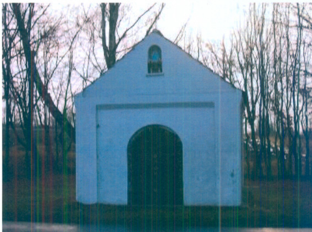
Fot. 3. Kapliczka przydrożna w Libidzy

Do roku 1993, to jest do czasu oddania kościoła parafialnego pw. Św. Jana Chrzciciela, w kapliczce odbywały się nabożeństwa i inne uroczystości kościelne.