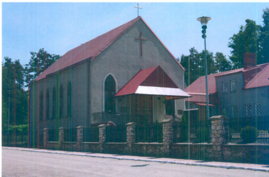
Fot. 4. Kościół pw. św. Jana Chrzciciela w Libidzy

Do roku 1993, to jest do czasu oddania kościoła parafialnego pw. Św. Jana Chrzciciela, w kapliczce odbywały się nabożeństwa i inne uroczystości kościelne.