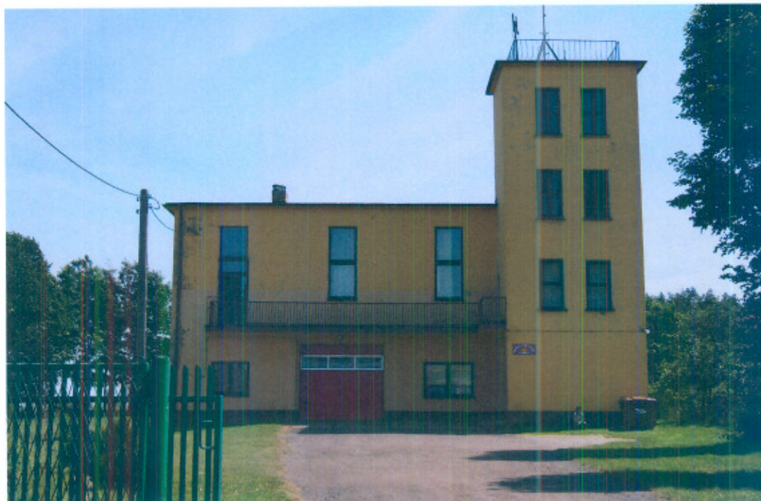
Fot. 8. Remiza Ochotniczej Straży Pożarnej w Libidzy