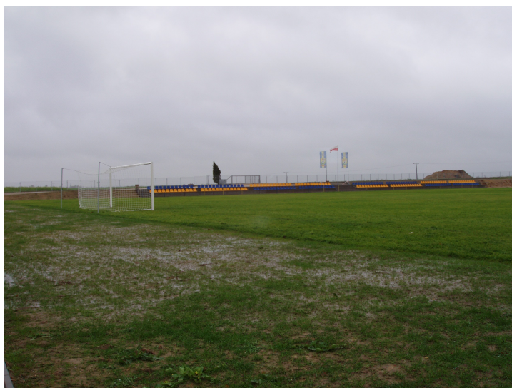
Fot. 2. Boisko do piłki nożnej wraz z siedziskami

W 2006 roku w ramach Sektorowego Programu Operacyjnego „Restrukturyzacja i modernizacja sektora żywnościowego oraz rozwój obszarów wiejskich 2004-2006”, w zakresie Priorytetu 2 „Zrównoważony rozwój obszarów wiejskich”, Działania 2.3 „Odnowa wsi oraz zachowanie i ochrona dziedzictwa kulturowego” został zrealizowany projekt „Rozwój bazy sportowo-rekreacyjnej w Łobodnie”.