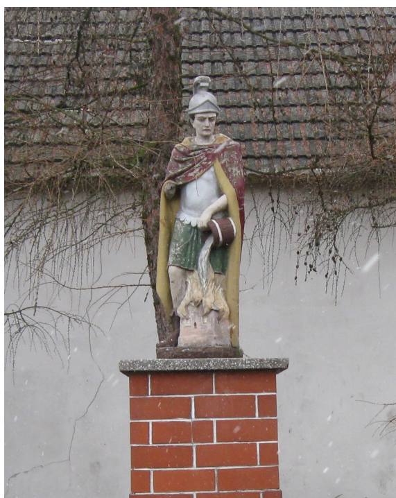
Fot. 10. Figurka św. Floriana przed budynkiem remizy