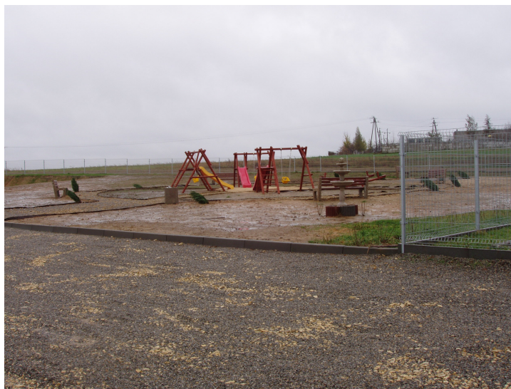
Fot. 3. Plac zabaw dla dzieci

Zagospodarowanie wolnego terenu na bazę sportowo-rekreacyjną stworzyło warunki do rozwoju sportu, aktywnego wypoczynku, organizacji imprez kulturalno - rekreacyjnych dla mieszkańców sołectwa.