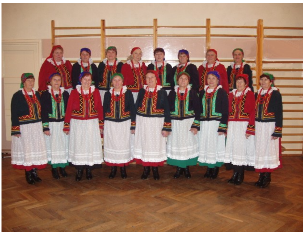
Fot. 9. Zespół Śpiewaczy „Łobodzianki” w nowych strojach

Podczas VII Jurajskiego Przeglądu Zespołów Ludowych „Obrzędy, zwyczaje, tradycje” w Koniecpolu „Łobodzianki” przedstawiły ciekawe widowisko obrzędowe „skubania pierza”. Podczas widowiska naprawdę skubały pierze, śpiewały, opowiadały legendy, dawne historie oraz dowcipy.