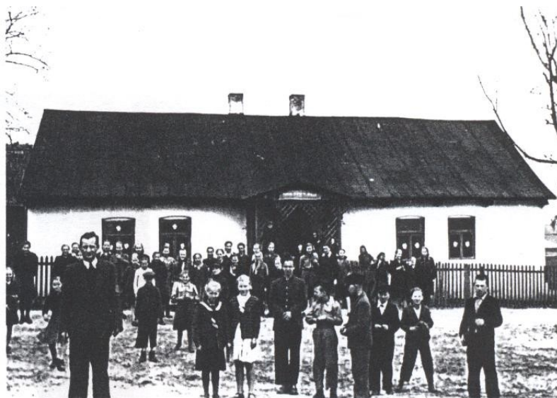
Fot. 4. Pierwsza szkoła w Łobodnie