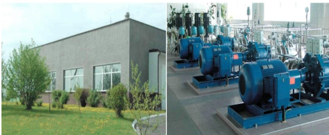
Fot. 6. Stacja Ujęcia Wody (SUW) „Łobodno”

W Łobodnie znajduje się Stacja Ujęcia Wody (SUW) „Łobodno” o wydajności 685 m 3 /h, która jest częścią systemu zaopatrującego w wodę pitną ponad 300.000 mieszkańców Częstochowy i okolic. Ujęcie czerpie wody z piętra wodonośnego jurajskiego.