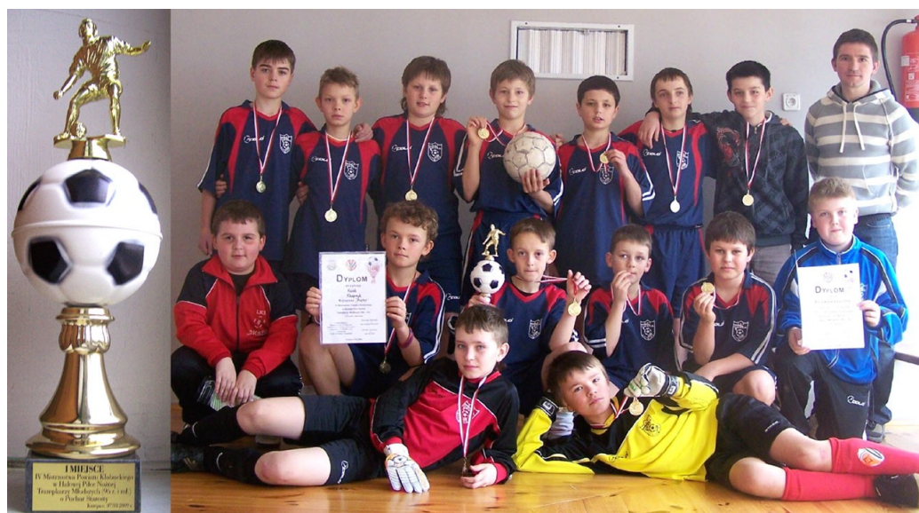
Fot. 8. Trampkarze młodzi

IV miejsce w II Turnieju Piłki Nożnej Halowej „MŁODZICY CUP” o Puchar Burmistrza Kłobucka