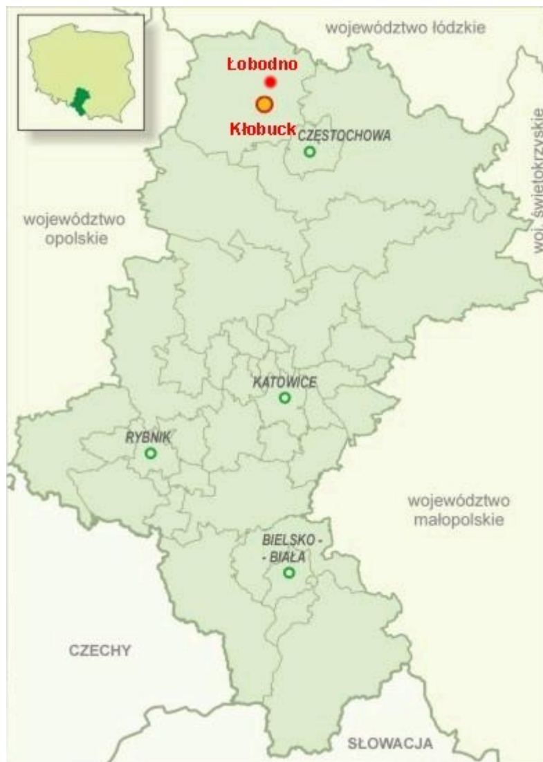
Rysunek 1. Lokalizacja miejscowości Łobodno w województwie śląskim i powiecie kłobuckim.

Miejscowość Łobodno położona jest w północno-wschodniej części gminy Kłobuck, w powiecie kłobuckim województwa śląskiego.