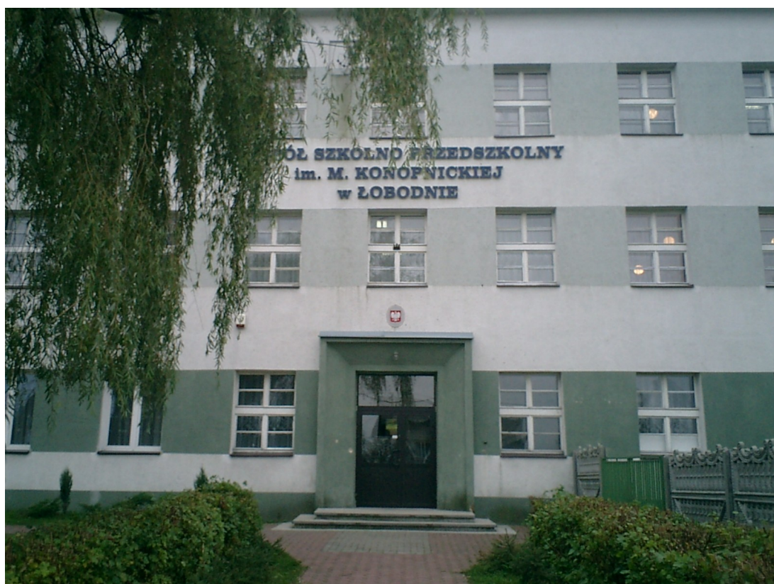
Fot. 5. Zespół Szkolno-Przedszkolny w Łobodnie

Do roku 2002 funkcjonowały dwie placówki oświatowe - Przedszkole Gminne i Szkoła Podstawowa. W roku 2002 utworzono Zespół Szkół, w skład którego weszła Szkoła Podstawowa i Gimnazjum. Od roku 2004 do Zespołu Szkół przyłączono Przedszkole Gminne. Wszystkie te placówki utworzyły Zespół Szkolno-Przedszkolny.