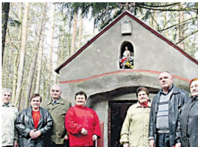
Fot. 1. Mieszkańcy Łobodna przed kapliczką

Co roku właśnie na świętą Annę tj. 26 lipca mieszkańcy Łobodna zbierają się tutaj i odbywa się przy tej kapliczce uroczyste nabożeństwo. Tradycją jest, że święto to łączy z dniem poświęconym św. Krzysztofowi, patronowi kierowców i podróżnych. Z tego powodu do lasu przyjeżdża wtedy wiele samochodów. To jedno z najważniejszych dla mieszkańców Łobodna świąt w roku.