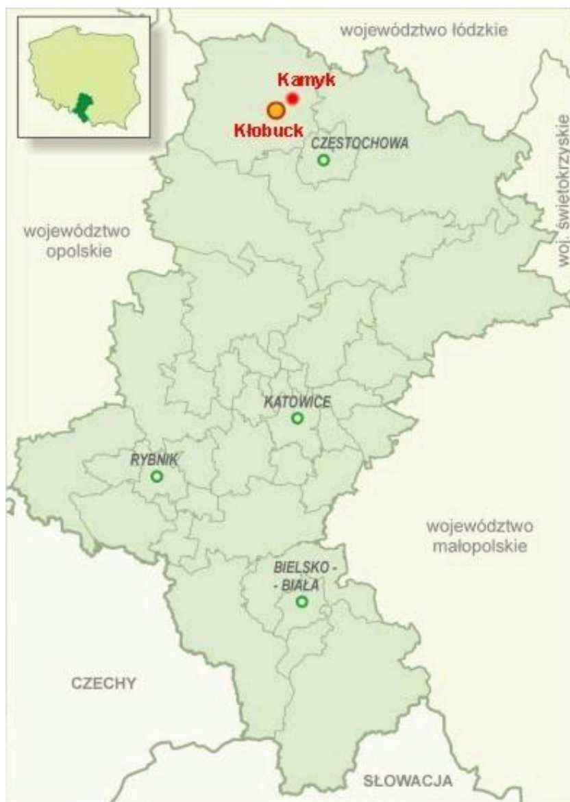
Rysunek 1. Lokalizacja miejscowości Kamyk w województwie śląskim i powiecie kłobuckim.

Miejscowość Kamyk położona jest w północnej części województwa śląskiego na Wyżynie Krakowsko-Wieluńskiej w powiecie kłobuckim.