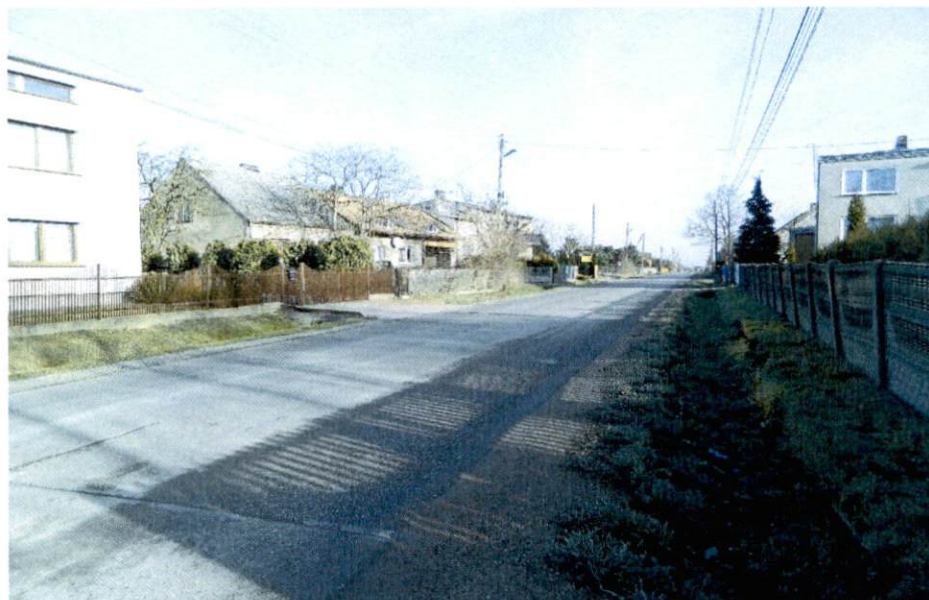
Fot. 8. Ulica Tartakowa – zabudowa po obu stronach drogi