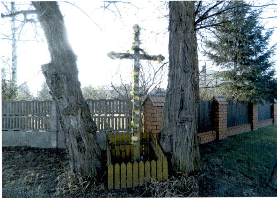
Fot. 5. Krzyż przydrożny przy zbiegu ulic: Olszowiec i Tartakowej