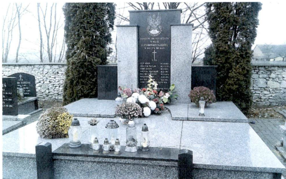
Fot. 7. Pomnik na cmentarzu w Białej

Około 10 lat temu badacze historii zabrali szczątki żołnierzy niemieckich, które zostały złożone na cmentarzu w Siemianowicach Śląskich.