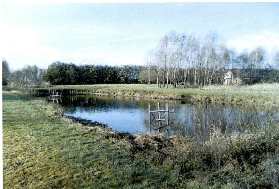
Fot. 4. Staw rybny

Obszar Borowianki charakteryzuje się nieznacznym zróżnicowaniem powierzchni terenu. Gleby występujące na tym terenie odznaczają się niewielką różnorodnością składu granulometrycznego. Przeważający udział mają gleby lekkie utworzone z piasków gliniastych. Gleby te są przydatne dla roślin o małych wymaganiach glebowych. Udział gleb lepszych rolniczo jest mały, natomiast brak jest gleb ciężkich i bardzo ciężkich, które są najkorzystniejsze dla potrzeb rolnictwa. Dominują gleby bielcowe i brunatne kwaśne, występują również gleby mułowo – torfowe.