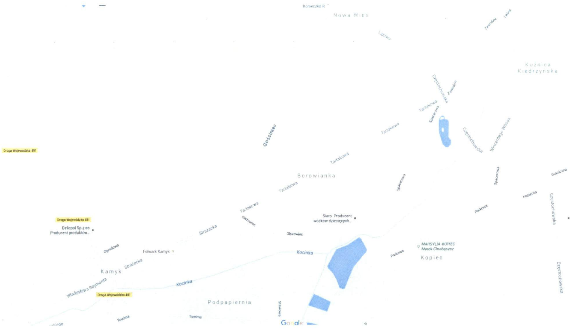
Rys. 3. Plan miejscowości Borowianka