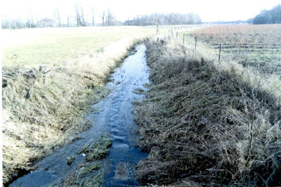
Fot. 3. Kocinka (Czarna Oksza)