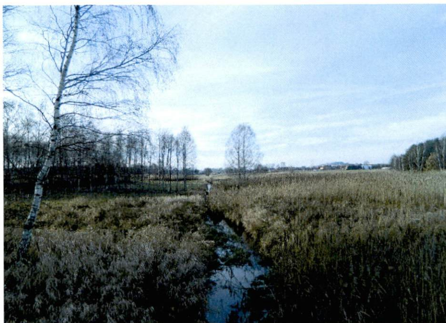
Fot. 2. Kocinka (Czarna Oksza)

Przez obszar Borowianki przepływa rzeka Kocinka (Czarna Oksza) druga co do wielkości rzeka w gminie. Największym jej dopływem jest rzeka Białka, której przy ujściu towarzyszą stawy rybne w miejscowości Kopiec.