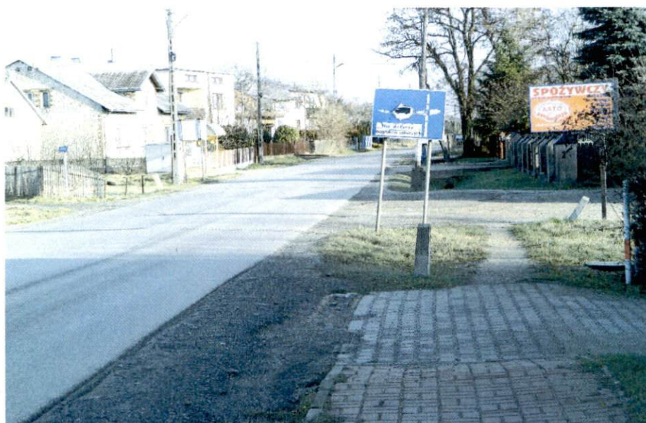
Fot. 1. Ulica Tartakowa

Główna droga w miejscowości Borowianka to droga powiatowa ul. Tartakowa. Ona też stanowi centrum miejscowości. Jadąc ul. Tartakową w kierunku północno-wschodnim dojeżdżamy do ul. Lipowej, również drogi powiatowej, którą w kierunku północno-zachodnim dojeżdżamy do odległej o 4 km miejscowości Nowa Wieś, a w kierunku południowo-wschodnim do Częstochowy. Do miejscowości Nowa Wieś prowadzi również droga gminna ul. Gościniec. Z kolei jadąc ul. Tartakową w kierunku południowo-zachodnim dojeżdżamy do miejscowości Kamyk i drogi wojewódzkiej nr 491 relacji Częstochowa-Łobodno-Raciszyn. Do miejscowości Kopiec od ul. Tartakowej prowadzą drogi gminne: ul. Olszowiec i Stawowa. Połączenie to stanowi alternatywę połączenia komunikacyjnego pomiędzy Borowianką a Częstochową w przypadku zamknięcia skrzyżowania dróg: powiatowych nr 2043S (ul. Reymonta) oraz nr 1025S (ul. Strażacka) i wojewódzkiej nr 491 (ul. Szkolna i ul. Grunwaldzka) w miejscowości Kamyk.