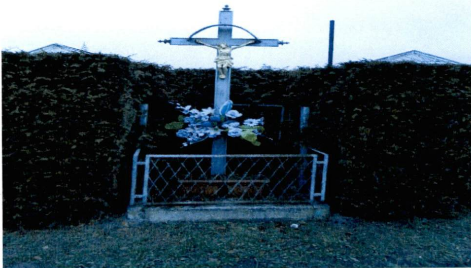
Fot. 6. Krzyż przydrożny przy ulicy Tartakowej

Krzyż przy ul Tartakowej wykonał i ustawił Karol Kuczera w ok. 1850 roku jako dowód swej wiary. Był to człowiek bardzo zdolny i głęboko wierzący. Przyjechał do Polski z Czech, ponieważ nie uznawali tam wiary katolickiej. Kupił pole na Borowiance, wybudował dom i postawił krzyż. Był cieślą, budował drewniane domy i młyny wodne.