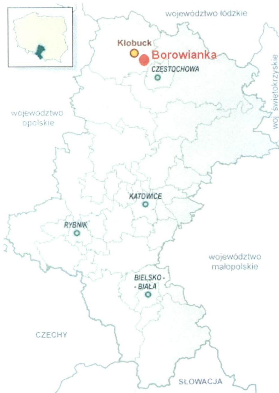
Rys. 1. Lokalizacja miejscowości Borowianka w województwie śląskim.

Miejscowość Borowianka położona jest w północnej części województwa śląskiego na Wyżynie Krakowsko-Wieluńskiej w powiecie kłobuckim, w gminie Kłobuck. Borowianka sąsiaduje z miejscowościami: Kamyk, Nowa Wieś, Kopiec, Kuźnica Kiedrzyńska. Do Borowianki należy 5 ulic: Tartakowa, Olszowiec Stawowa, Kopiecka i Gościniec. W latach 1975-1998 miejscowość administracyjnie należała do województwa częstochowskiego.