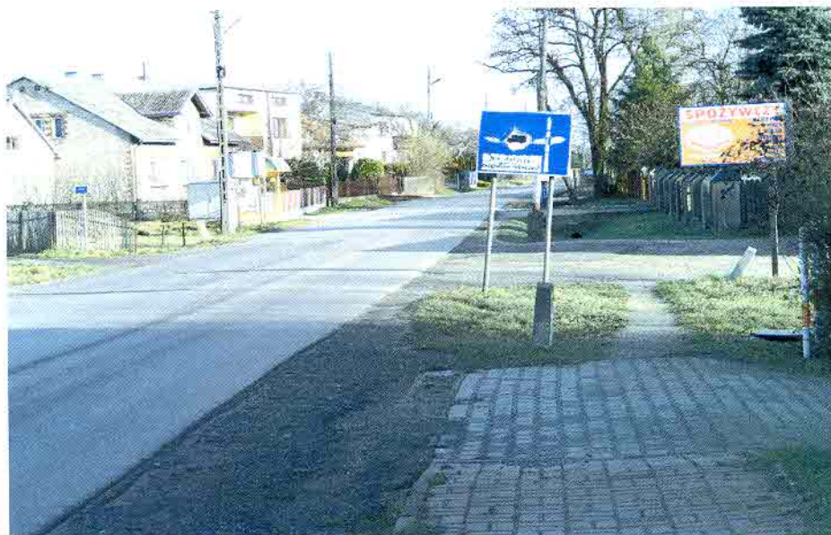
Fot. 1. Ulica Tartakowa

Główna droga w miejscowości Borowianka to droga powiatowa ul. Tartakowa. Ona też stanowi centrum miejscowości. Jadąc ul. Tartakową w kierunku północno-wschodnim dojeżdżamy do ul. Lipowej, również drogi powiatowej, którą w kierunku północno-zachodnim dojeżdżamy do odległej o 4 km miejscowości Nowa Wieś, a w kierunku południowo-wschodnim do Częstochowy. Do miejscowości Nowa Wieś prowadzi również droga gminna ul. Gościniec. Z kolei jadąc ul. Tartakową w kierunku południowo-zachodnim dojeżdżamy do miejscowości Kamyk i drogi wojewódzkiej nr 491 relacji Częstochowa-Lobodno-Raciszyn. Do miejscowości Kopiec od ul. Tartakowej prowadzą drogi gminne: ul. Olszowiec i Stawowa. Połączenie to stanowi alternatywę połączenia komunikacyjnego pomiędzy Borowianką a Częstochową w przypadku zamknięcia skrzyżowania dróg: powiatowych nr 2043S (ul. Reymonta) oraz nr 1025S (ul. Strażacka) i wojewódzkiej nr 491 (ul. Szkolna i ul. Grunwaldzka) w miejscowości Kamyk.