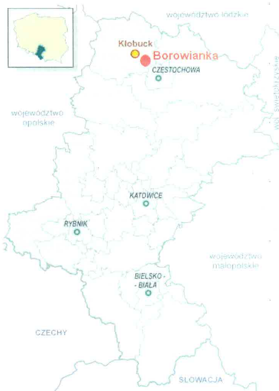
Rys. 1. Lokalizacja miejscowości Borowianka w województwie śląskim.

Miejscowość Borowianka położona jest w północnej części województwa śląskiego na Wyżynie Krakowsko-Wieluńskiej w powiecie kłobuckim, w gminie Kłobuck. Borowianka sąsiaduje z miejscowościami: Kamyk, Nowa Wieś, Kopiec, Kuźnica Kiedrzyńska. Do Borowianki należy 5 ulic: Tartakowa, Olszowiec Stawowa, Kopiecka i Gościniec. W latach 1975-1998 miejscowość administracyjnie należała do województwa częstochowskiego.