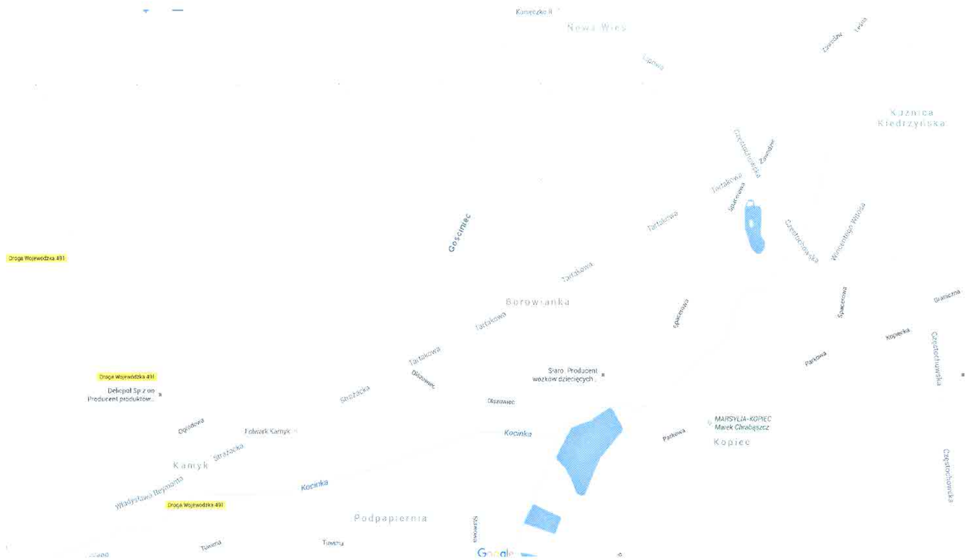
Rys. 3. Plan miejscowości Borowianka